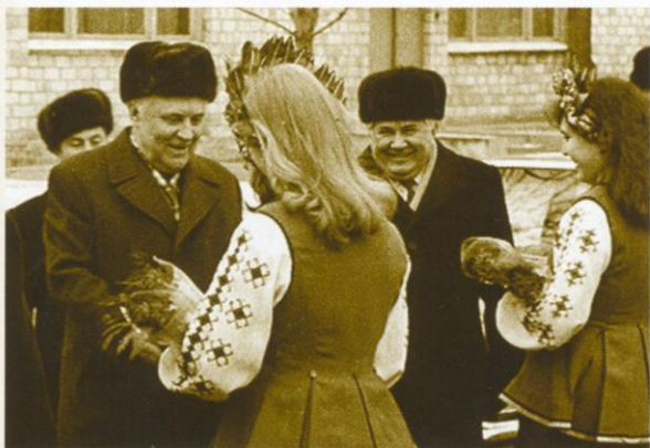
Перший секретар ЦК КПУ В.В. Щербицький (ліворуч) і секретар Київського міського КПУ Ю.Н. Єльченко на ВО «Київський радіозавод». 70-ті рр. XX ст.

Minister of the general machine building S.Afanasiyev (at the center), general designer of the DB «Yuzhnoye» S.Konyukhov (on the right), general designer of the missile SS-18 («Satan») S.U. (on the left). Dnepropetrovsk. 80s of XX century