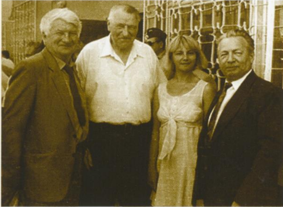
Міністр загального машинобудування С.А. Афанасьєв (в центрі), генеральний конструктор КБ «Південне» С.Н. Конюхов (праворуч), головний конструктор ракети СС-18 («Сатана») С.І. Ус (ліворуч). Дніпропетровськ. 80-ті рр. XX ст.

Minister of the general machine building S.Afanasiyev (at the center), general designer of the DB «Yuzhnoye» S.Konyukhov (on the right), general designer of the missile SS-18 («Satan») S.U. (on the left). Dnepropetrovsk. 80s of XX century